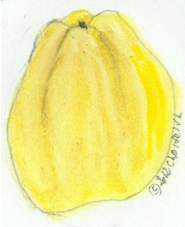
pastel Choisel jean-louis © 2012